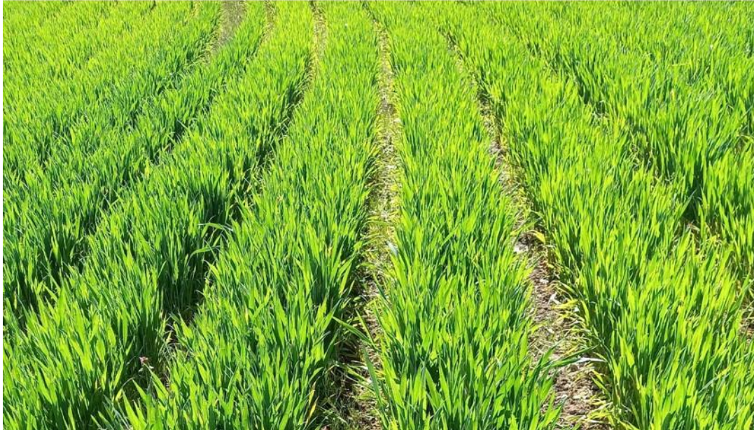
Figure 4 : exemple de céréales en lignes de semis espacées

A partir de 2023, les céréales en lignes de semis espacées seront intégrées dans la liste des nouveaux types de surfaces de promotion de la biodiversité (type de SPB). Ce nouveau type de SPB soutient par exemple la promotion du lièvre brun et de l'alouette des champs ainsi que de la flore accompagnatrice des grandes cultures.